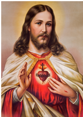
Obrazek nr 3

Modlitwa za Mamę Boże Ojcze, dziękuję Ci za miłość do mojej mamy, która jest zaszczipiona w sercu moim. Nie dopuść, aby to uczucie kiedykolwiek wygasto we mnie; chroń mię od tego wszystkiego, co by ją zmartwić lub zasmucić mogło i nie pozwól, abym zapomniał, że jej życie, wychowanie i opiekę winien jestem. Nie mogę się jej odwdziżyć za wszystkie dobro jakie mi wyświadczyła, Ty więc, o mój Boże, nagródź ją za mnie. Ześlij na nią wszystko co dobre, pozwól jej długo i szczęśliwie żyć, a mną tak kieruj, ażebym zawsze ją szanował i kochał, żadnej przykrości jej nie sprawił, a z czasem stał się podporą w jej starości. Amen.