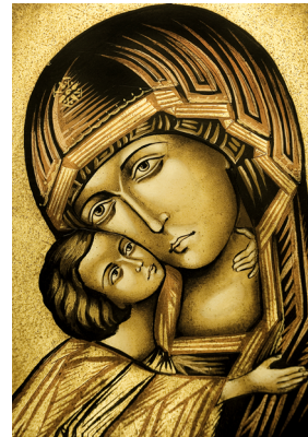
Obrazek nr 2

Modlitwa Matki O Niepokalana Dziewico, Ty, która jesteś Matką Jezusa i moją, przez miłość św. Rity spójrz na mnie ponosząca słodką i ważną odpowiedzialność matki. Tobie, o Maryjo, polecam moje dzieci, które tak bardzo kocham, dla których tak bardzo cierpię i za które odpowiadam przed Twoim Boskim Synem. Naucz mnie prowadzić je tak, jak to czyniła św. Rita, po pewnej drodze prowadzącej do Boga. Spraw, abym była pełna czułości, ale bez słabości, silna, ale bez surowości. Uproś dla mnie tę cierpliwość, która nigdy się nie kończy, wszystko znosi, gdyż ma jako ostateczny cel zbawienie moich dzieci. Matko Boża, pomóż mi w tym trudnym zadaniu! Uformuj moje serce na podobieństwo Twojego serca i spraw, aby moje dzieci widziały we mnie odbłask Twoich cnót, abym umiała je nauczyć kochać Ciebie i służyć Tobie na tej ziemi, byśmy kiedyś mogli znaleźć się w niebie wychwalając Cię i błogosławiąc. Dlatego proszę Cię, Królowo Świętych, abys otoczyła je opieką św. Rity z Cascia. Amen.