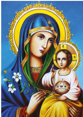
Obrazek nr 1

Modlitwa Matki O Niepokalana Dziewico, Ty, która jesteś Matką Jezusa i moją, przez miłość św. Rity spójrz na mnie ponosząca słodką i ważną odpowiedzialność matki. Tobie, o Maryjo, polecam moje dzieci, które tak bardzo kocham, dla których tak bardzo cierpię i za które odpowiadam przed Twoim Boskim Synem. Naucz mnie prowadzić je tak, jak to czyniła św. Rita, po pewnej drodze prowadzącej do Boga. Spraw, abym była pełna czułości, ale bez słabości, silna, ale bez surowości. Uproś dla mnie tę cierpliwość, która nigdy się nie kończy, wszystko znosi, gdyż ma jako ostateczny cel zbawienie moich dzieci. Matko Boża, pomóż mi w tym trudnym zadaniu! Uformuj moje serce na podobieństwo Twojego serca i spraw, aby moje dzieci widziały we mnie odbłask Twoich cnót, abym umiała je nauczyć kochać Ciebie i służyć Tobie na tej ziemi, byśmy kiedyś mogli znaleźć się w niebie wychwalając Cię i błogosławiąc. Dlatego proszę Cię, Królowo Świętych, abys otoczyła je opieką św. Rity z Cascia. Amen.