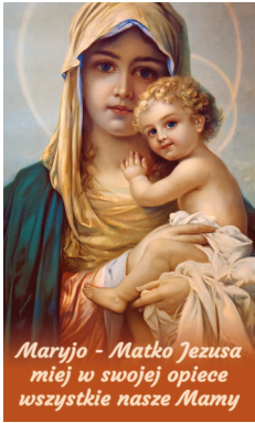
Baner nr 1