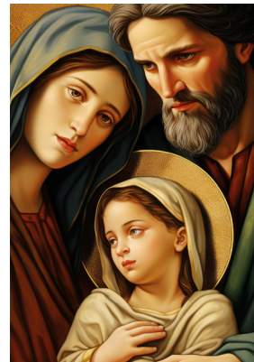
Obrazek nr 4

Modlitwa za Mamę Boże Ojcze, dziękuję Ci za miłość do mojej mamy, która jest zaszczipiona w sercu moim. Nie dopuść, aby to uczucie kiedykolwiek wygasto we mnie; chroń mię od tego wszystkiego, co by ją zmartwić lub zasmucić mogło i nie pozwól, abym zapomniał, że jej życie, wychowanie i opiekę winien jestem. Nie mogę się jej odwdziżyć za wszystkie dobro jakie mi wyświadczyła, Ty więc, o mój Boże, nagródź ją za mnie. Ześlij na nią wszystko co dobre, pozwól jej długo i szczęśliwie żyć, a mną tak kieruj, ażebym zawsze ją szanował i kochał, żadnej przykrości jej nie sprawił, a z czasem stał się podporą w jej starości. Amen.