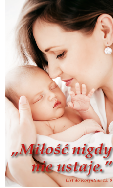
Baner nr 3