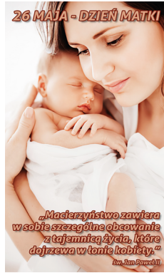
Baner nr 2